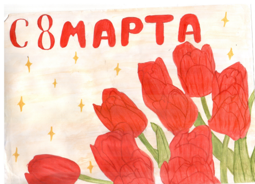
Рисунок Трофимовой Ксении

В этот день весенний мы поздравляем Вас. Исполнения всех мечтаний Пожелаем в этот час.